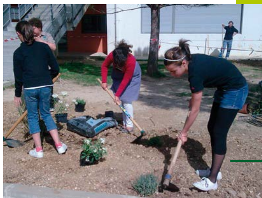
Atelier jardin - Demain la Terre