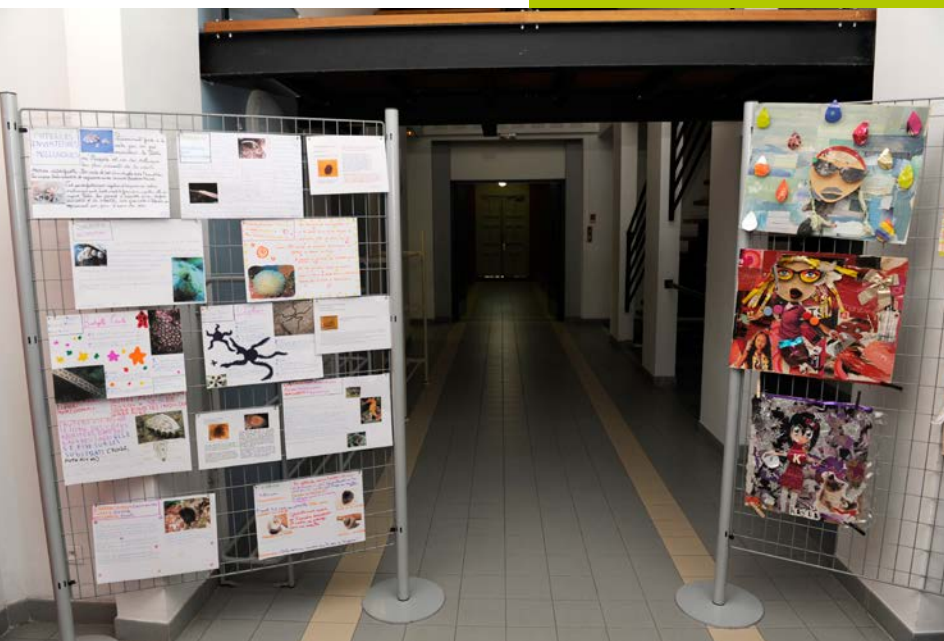
Collège Jean Jaurès à Mèze