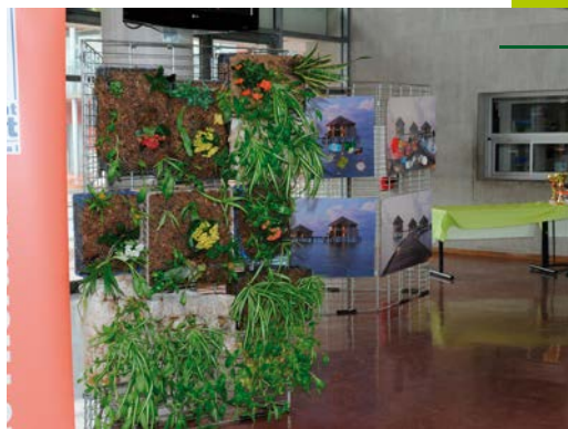
Biodiversité : « la nature en ville »