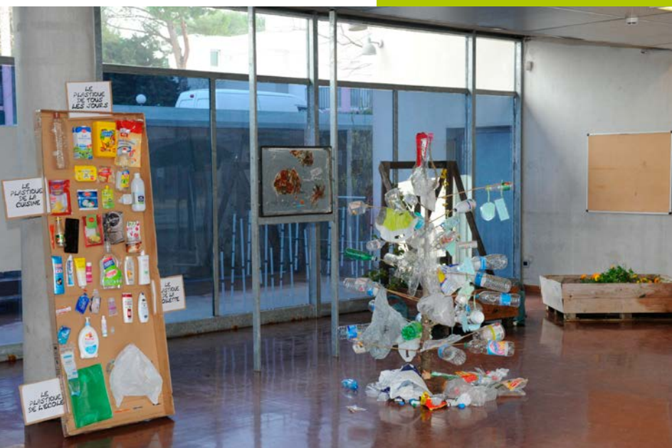
Collège Las Cazes à Montpellier