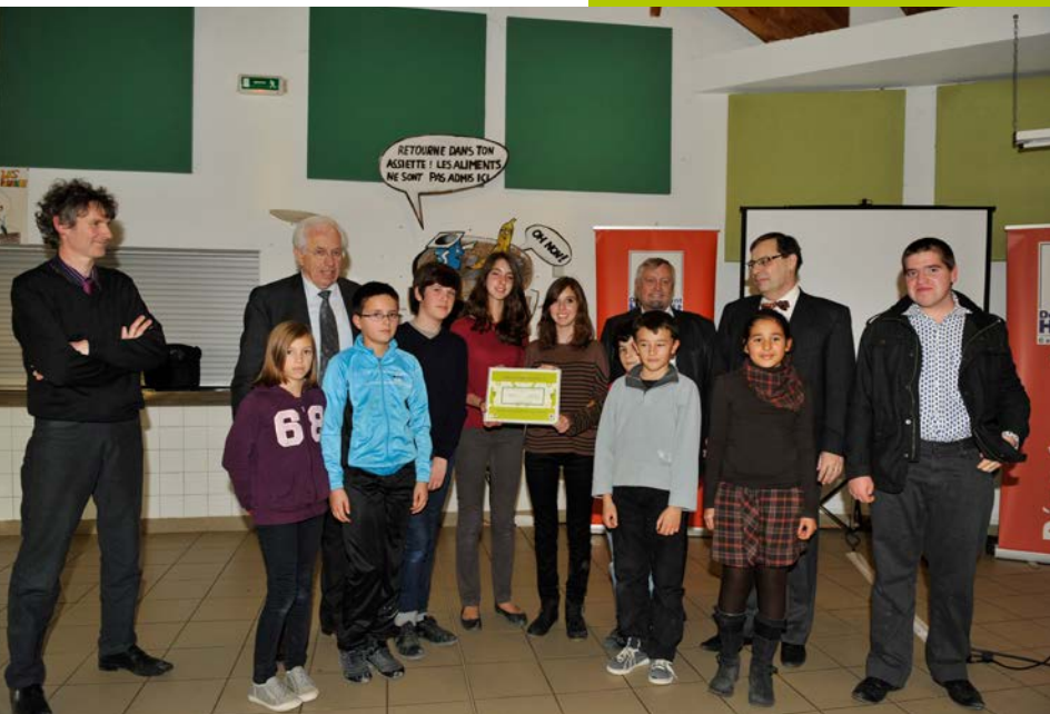
Collège François Mitterrand à Clapiers